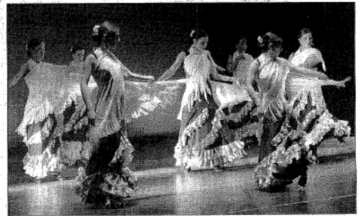
El flamenco tuvo su momento, al son de la guitarra y de la voz de un cantaor.